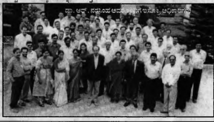
ಡಾ. ಆರ್. ನರಸಿಂಹ ಅವರ ಅಧ್ಯಯನ ಅಧಿಕಾರಿಗಳು

ನಿಲಯ ಹಾಗೂ ಕಾಲೇಜು ಪ್ರಾಧ್ಯಾಪಕರುಗಳಿಗೆ ಶೈಕ್ಷಣಿಕ ವಿಷಯಗಳ ಬಗ್ಗೆ IFS, IASನ ಪ್ರೊಬೇಶನರುಗಳಿಗೆ ಅವರ ಕಾರ್ಯಕ್ಷೇತ್ರಗಳ ನಿರ್ವಹಣೆಯ ಬಗ್ಗೆ ಹೀಗೆ ಹಲವಾರು ರೀತಿಯ ತರಬೇತಿ ಶಿಬಿರಗಳನ್ನು ವರ್ಷದ ವಿವಿಧ ಸಮಯಗಳಲ್ಲಿ ನಡೆಸಲಾಗುತ್ತದೆ. ISRO ದ ಅಧಿಕಾರಿಗಳಿಗೂ ವಿಶೇಷ ಕಾರ್ಯಾಗಾರವನ್ನು ನಡೆಸಲಾಗಿದೆ. ಮೂರನೆಯದಾಗಿ ಇಲ್ಲಿ ರಾಷ್ಟ್ರ ಹಾಗೂ ಅಂತರರಾಷ್ಟ್ರೀಯ ಮಟ್ಟದ ವಿಚಾರ ಸಂಕರಣ ಹಾಗೂ ಸಮ್ಮೇಳನಗಳನ್ನು ನಡೆಸಲಾಗುತ್ತದೆ. ಆಗಾಗ್ಗೆ ವ್ಯವಸ್ಥೆಗೊಳ್ಳುವ ಈ ಕಾರ್ಯಕ್ರಮಗಳಲ್ಲಿ ವಿಜ್ಞಾನ, ಮಾಹಿತಿ ತಂತ್ರಜ್ಞಾನ, ಸಾಮಾಜಿಕ ಸಮಸ್ಯೆಗಳು, ಮಾನವ ಕಲ್ಯಾಣ ಹೀಗೆ ಹಲವಾರು ವಿಷಯಗಳಿಗೆ ಸಂಬಂಧಿಸಿದಂತೆ ವಿಚಾರ ವಿನಿಮಯಗಳು ನಡೆಯುತ್ತವೆ. ವಿವಿಧ ಕ್ಷೇತ್ರಗಳಿಗೆ ಸಂಬಂಧಿಸಿದಂತೆ ನಡೆಯುವ ಸಂಶೋಧನೆಗಳು, ಉಪನ್ಯಾಸಗಳು, ವಿಚಾರ ಸಂಕರಣಗಳ ವರದಿಗಳು, ಪ್ರೌಢ ಪ್ರಬಂಧಗಳನ್ನು ರಾಷ್ಟ್ರ ಹಾಗೂ ಅಂತಾರಾಷ್ಟ್ರೀಯ ನಿಯತಕಾಲಿಕಗಳಲ್ಲಿ ಪ್ರಕಟಿಸುತ್ತಾರೆ. ಇಲ್ಲಿಯ ಬೋಧಕ ವರ್ಗದಲ್ಲಿ ಡಾ. ಆರ್. ನರಸಿಂಹ, ಡಾ. ರಾಜಾರಾಮಣ್ಣರವರ ಮೊದಲಾಗಿ ದೇಶದ ಅತ್ಯಂತ ಉನ್ನತ ಹಾಗೂ ಶ್ರೇಷ್ಠ ತಜ್ಞರು, ವಿದ್ವಾಂಸರು, ವಿಜ್ಞಾನಿಗಳು ಇದ್ದಾರೆ. ಆಗಾಗ್ಗೆ ದೇಶ ವಿದೇಶಗಳಿಂದ ಇತರ ತಜ್ಞರೂ ಬಂದು ಅಹ್ವಾನಿತ ಉಪನ್ಯಾಸಗಳನ್ನು ನೀಡುತ್ತಾರೆ.